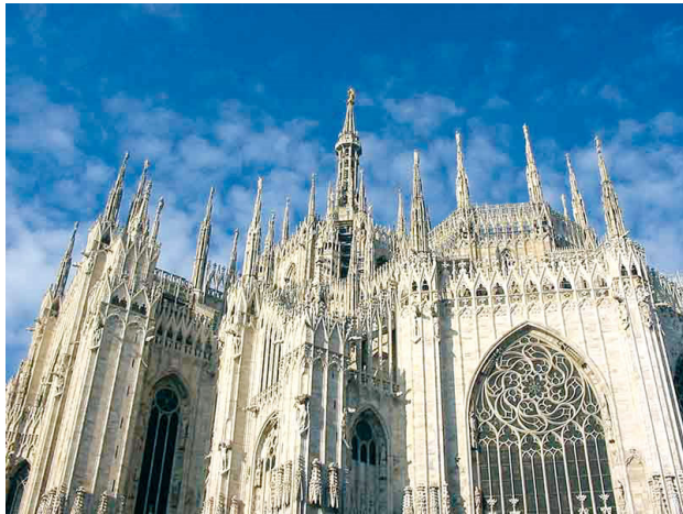
Mailand Dom

Bei einer kurzen Panoramarundfahrt erhalten Sie erste Eindrücke der oberitalienischen Metropole, die, wie keine andere Stadt, italienische Kunst, Musik und Mode repräsentiert. Hier sind die erfolgreichsten Unternehmen des Landes angesiedelt, finden die wichtigsten Messen statt und hier hat die größte Börse Italiens ihren Sitz. Doch in der lombardischen Metropole wird nicht nur gearbeitet, man weiß auch gut zu leben. Neben kulturellen und historischen Denkmälern findet man südländische Lebensqualität, Straßencafés und gute Restaurants.