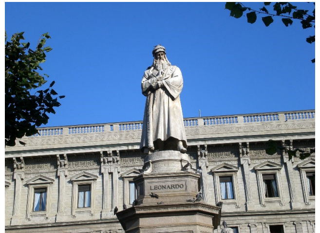
Leonardo da Vinci Mailand

Um das Wirken von Leonardo da Vinci verstehen zu können, werden Sie heute in das kulturelle Umfeld eintauchen, in dem er lebte. Ein geeigneter Ort ist die Pinacoteca Ambrosiana , eine wahre Schatztruhe, die sein „Portrait eines Musikers“ und seinen „ Codex Atlanticus “ aus dem Jahre 1353 beherbergt. Der Kodex ist eine beeindruckende Sammlung von Studien und Zeichnungen, die den Maßstab für Leonardos Genie verdeutlicht. Er war neugierig auf alles; kein Aspekt der Wirklichkeit war ihm gleichgültig. Die Sammlung befindet sich in der angeschlossenen Ambrosianischen Bibliothek , eine der ersten öffentlichen Bibliotheken in Europa. Sie besitzt heute 700 000 Bücher, darunter eine illustrierte „Ilias“ aus dem 5. Jh. und eine Ausgabe der „Göttlichen Komödie“ von Dante.