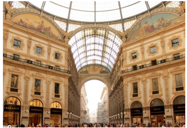
Galleria Vitt. Emanuele II

Stimmen Sie sich bei einem gemeinsamen Abendessen im Hotel auf die kommenden Tage ein!