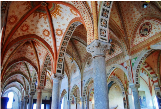
Santa Maria delle Grazie

Sie besuchen die Dominikanerklosterkirche Santa Maria delle Grazie aus dem 15. Jh. Bramante gestaltete den Chor und die mächtige Kuppel sowie die interessante alte Sakristei und den Kreuzgang. Im Refektorium sehen Sie Leonardo da Vincis „ Das letzte Abendmahl “, eines der bekanntesten Wandgemälde der Welt. Perspektive, Lichteinfall und Komposition sind beispiellos und waren bahnbrechend für die Malerei. Schon zu Lebzeiten da Vincis sorgte das Abendmahl für kontroverse Auseinandersetzungen.