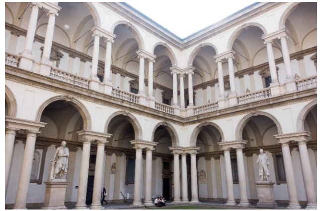
Pinacoteca di Brera

Gemeinsames Mittagessen im Brera-Viertel.